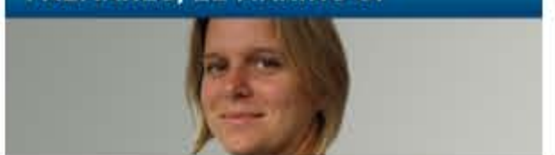
Les coulisses des classements des grandes écoles d'ingénieurs par Sylvie Lecherbonnier