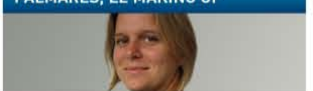
Les coulisses des classements des grandes écoles d'ingénieurs par Sylvie Lecherbonnier